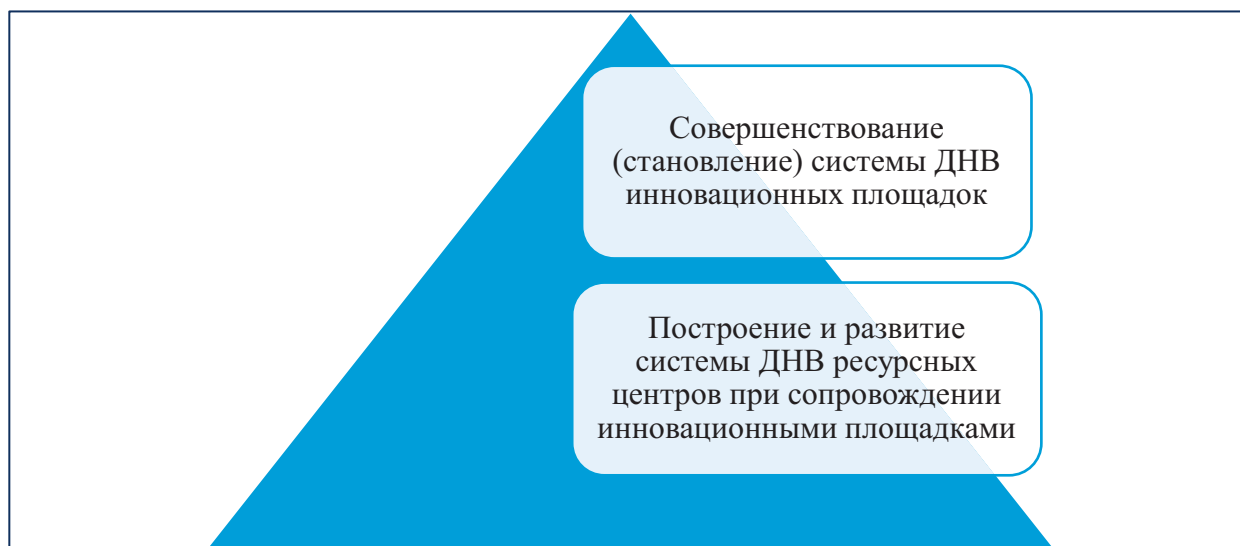
Рисунок 1. Модель двухуровневой сети ИП и РЦ

в своей ДОО, способствовали развитию, а в некоторых случаях и формированию, такой системы в ДОО – ресурсных центрах. При этом уровень профессиональных компетенций педагогов и ИП, и РЦ значительно возрос.